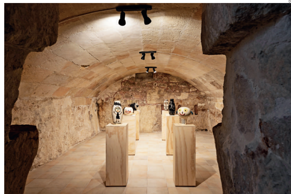
Em cima, o interior do Mercado de Mahón. À esquerda, a galeria Etesian, na Ciutadella de Menorca; em baixo, um detalhe do espaço expositivo da Ilha do Rei - Hauser & Wirth, onde decorre uma retrospectiva que celebra o escultor Eduardo Chillida